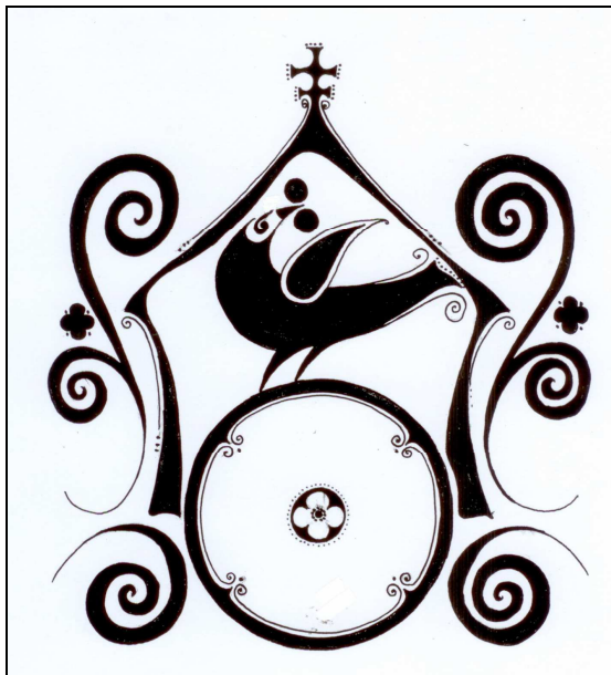
Kóczián Csaba rajza