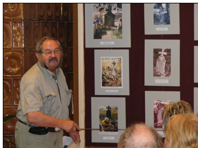
A „Képek a múltból” című kiállítás megnyitóján a Szlovák Ház nagytermében.

Az Országos Honismereti Mozgalom tagjaként évenként részt vesz a szervezet rendezvényein; gyerekek és felnőttek körében tartott helytörténeti és honismereti ismertetőket. Nagy figyelmet szentel a ciszterci kolostornak és a pálos hagyományoknak, megszerzett ismereteit a modern technika segítségével népszerűsíti. Sokat tett/tesz az Erdőbirtokosság újjáélesztéséért.